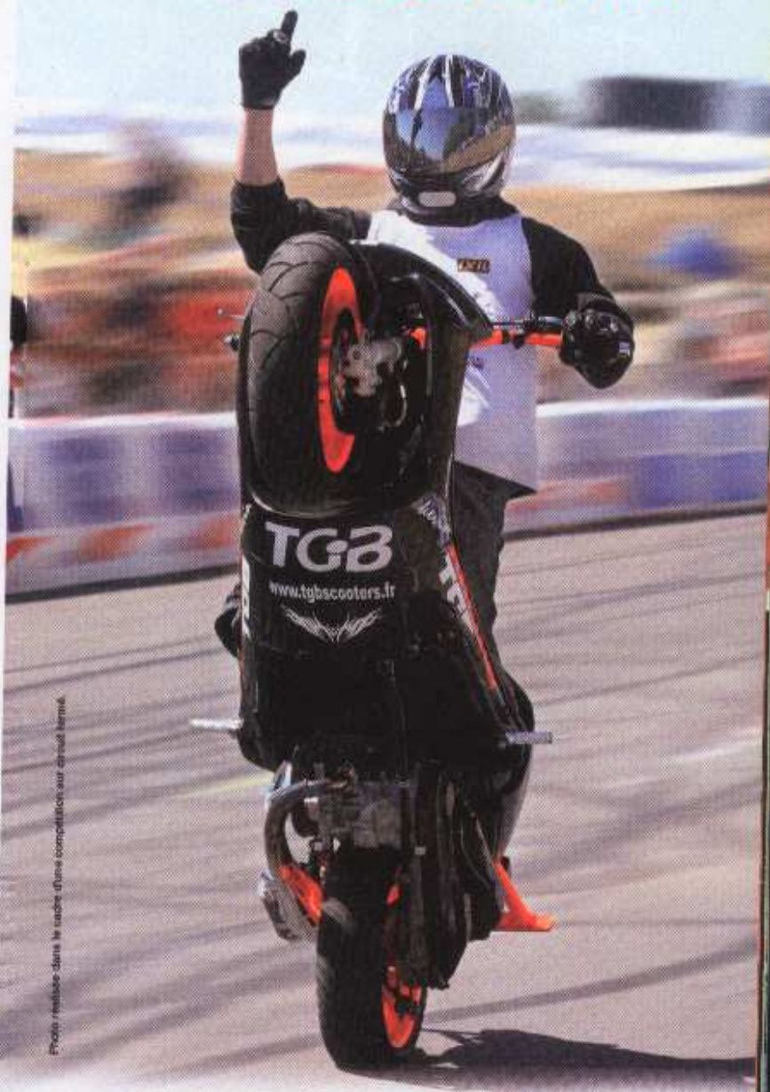
Photo réalisée dans le cadre d'une compétition sur circuit fermé.