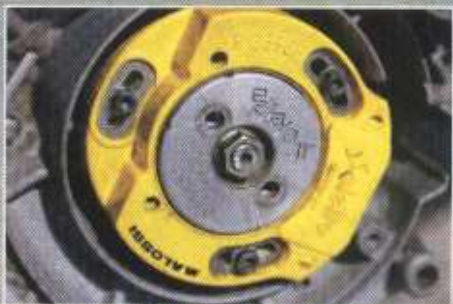
Dany a retenu l'allumage Malossi, parfaitement assorti à la teinte de ses coques.