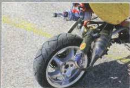
Ça se passe de commentaires, non ?