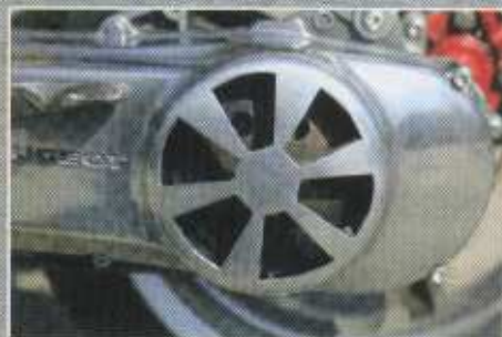
Magnifique découpe du carter de kick !

Pour faire dans l'originalité et la démesure, on félicite